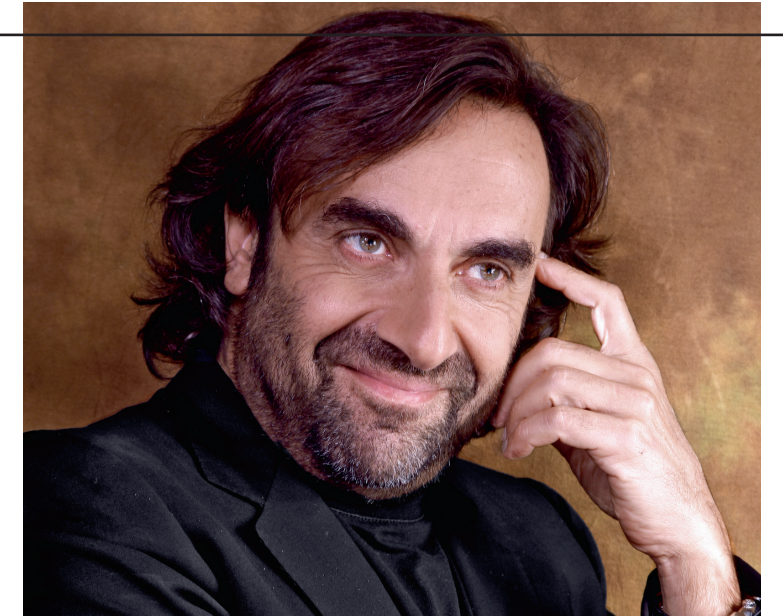
ANDRÉ MANOUKIAN MUSICIEN, AUTEUR-COMPOSITEUR

ILLUSTRATION BENJAMIN LE BRETON POUR BETC.